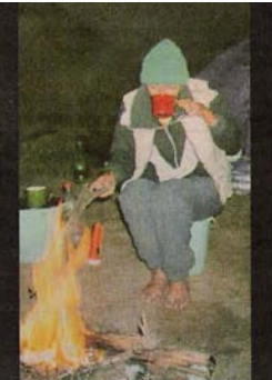
"Ons was vuil en moeg, maar my roeitog deur die Oranjerivier het my op een van die belangrikste reise van my lewe geneem."