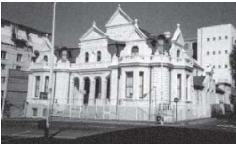
NG Gemeente Tafelberg in Kaapstad waar Koot Vorster 44 jaar leraar was.

10 Desember 1944 het 'n nuwe fase van sy lewe begin met 'n boodskap uit Openbaring 3 (Vorster 1969:32-35).